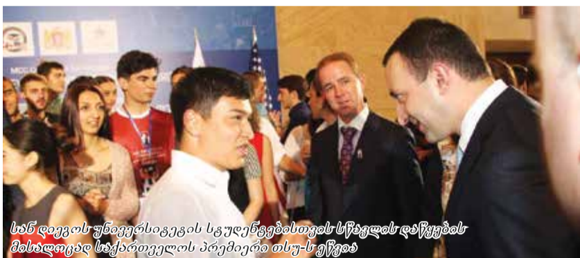
სან დიეგოს უნივერსიტეტის სტუდენტებისთვის სწავლას დაწყების მისაღწევად საქართველოს პრემიერი თსუ-ს ეწვია

2014 წლის ივლისში ამერიკის შეერთებული შტატების მთავრობის, აშშ-ს ათასწლეულის გამოწვევის კორპორაციის, მეორე კომპაქტის ფარგლებში თანამშრომლობის მემორანდუმში გაფორმდა სან დიეგოს სახელმწიფო უნივერსიტეტთან, რომლის პარტნიორები საქართველოში თსუ, ილიას სახელმწიფო უნივერსიტეტი და საქართველოს ტექნიკური უნივერსიტეტი გახდნენ. მისი მეშვეობით სტუდენტებს შესაძლებლობა მიეცათ მიიღონ ამერიკული განათლება და ამერიკული დიპლომი საქართველოში. კერძოდ, გაიარონ საერთაშორისო აკრედიტაციის მქონე საბაკალავრო პროგრამები საინჟინრო და ტექნოლოგიურ დარგებში. დაახლოებით ერთი წლის შემდეგ, 17 სექტემბერს სან დიეგოს სახელმწიფო უნივერსიტეტის საბაკალავრო პროგრამაზე ჩარიცხულ სტუდენტებს სწავლის დაწყება თსუ-ში თვითნებურად მიულოცეს.