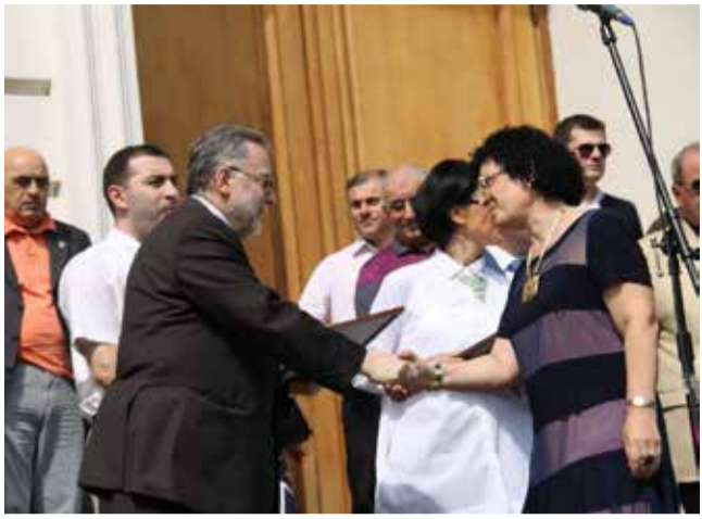
წლის საუკეთესო პედაგოგები დაჯილდოვდნენ

„დღეს ვხსნივთ ახალ 2015-2016 სასწავლო წელს. 4000-მდე ახალი სტუდენტი შემოემავა ჩვენს უნივერსიტეტს. ვულოცავ პირველკურსელების ცხოვრების ახალი ეტაპის დაწყებას და მინდა მათ უსუსურად წარმატება და შინაარსიანი საუნივერსიტეტო ცხოვრება“, – განაცხადა თსუ რექტორმა, აკადემიკოსმა ვლადიმერ პაპავამ. „ბოლო წლების განმავლობაში გრადიუალად მოვიდეთ ჩემს მშობლიურ უნივერსიტეტში, რათა უნივერსიტეტულმა აქედან მიველოცო სასწავლო წლის დაწყება. განსაკუთრებით მნიშვნელოვანია ეს დღე პირველკურსელებისთვის, რომლებმაც ცხოვრების სხვა ეტაპი დაიწყეს. მათი მომავალი დიდწილად იმდენად დამოკიდებულია რამდენად მაქსიმალურად წაიღებენ უნივერსიტეტული ცხოვრების, როგორც ცოდნის და განათლების, როგორც მათ ჩვენს დიდი პედაგოგები მიაწოდებენ. დარწმუნებული ვარ, თითოეული მათგანი იქნება წარმატებული“, – აღნიშნა ქალაქ თბილისის მერმა დავით ნარმანიამ. საქართველოს განათლებისა და მეცნიერების მინისტრის თამარ სანიკიძის თქმით, „დღეს სწავლა იწყება უნივერსიტეტებში, სკოლებში და მინდა ვისარგებლო მომენტით და ახალი სასწავლო წელი მი-